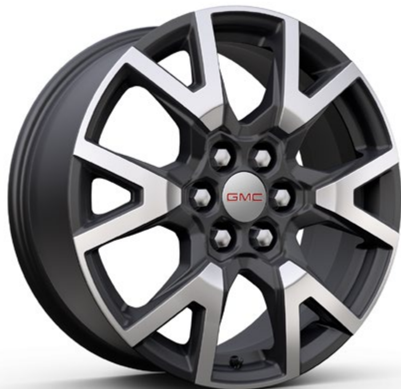
عجلات قياسية قياس 18 إنش من الألمنيوم