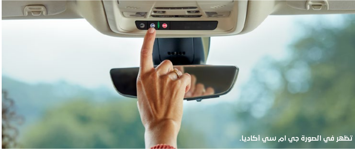
تظهر في الصورة جي ام سي أكاديا.