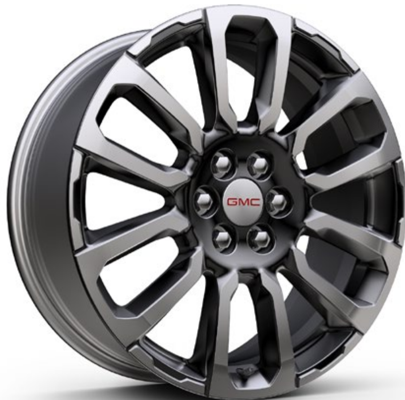
عجلات قياس 20 إنش من الألمنيوم البراق المشغول آلياً